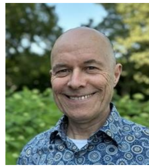
Koen Noord West